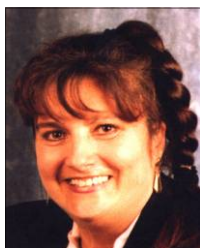
Coordinatrice Testa Dominique Federcasalinghe DonnEuropee